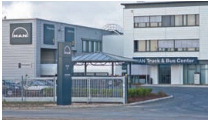
Hundhausen war Generalunternehmer beim Bau des MAN Truck & Bus Center Köln-Düsseldorf

Bauvorhaben ermöglicht effektive Koordination aller Projektphasen. Die funktionalen Hallen mit überzeugender Industriearchitektur werden nach einem bewährten System errichtet.